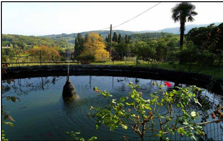
Villa di Groppoli – Giardino Sonoro

Provenendo da Montecatini: Percorrere la statale in direzione Pistoia, subito dopo la localita' Stazione Masotti e prima del bivio per Spazzavento svoltare a sinistra seguendo il cartello "Fattoria di Groppoli". Si percorre la strada asfaltata trovando prima la "Fattoria" poi, proseguendo, si troverà il piazzale sterrato parcheggio della villa.